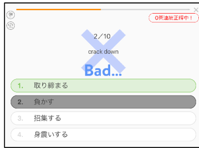
[ 英単語の出題画面 ]

このアプリは、毎日計画を立てて英単語を覚えるための支援アプリです。1日に学習する単語の数や難易度を設定し、学習意欲を持たせられるようになっています。出題は、10問1セットで、単語の意味を選択肢から選びます。間違っ単語は繰り返し学習することもでき、1週間の単語の学習状況等を学習履歴で確認することができます。扱っている単語は、小中学生レベルから大学受験レベル、様々な英語の検定レベルがあり、幅広い年代で活用ができます。iOS版、Android版共に提供されています。是非使ってみてください。