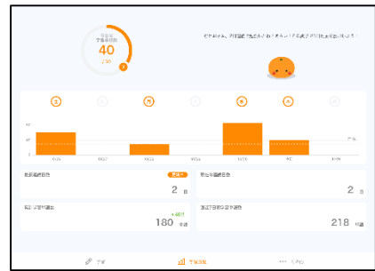
[ 学習履歴の確認画面 ]