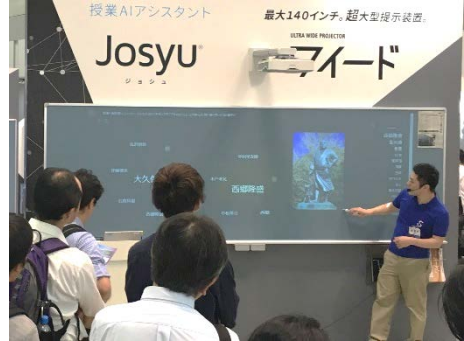
[ 教育 IT ソリューション EXPO ]