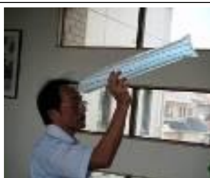
⑤ とばして あそぼう。