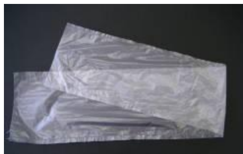
ざいりょうです。(かさぶくろ)