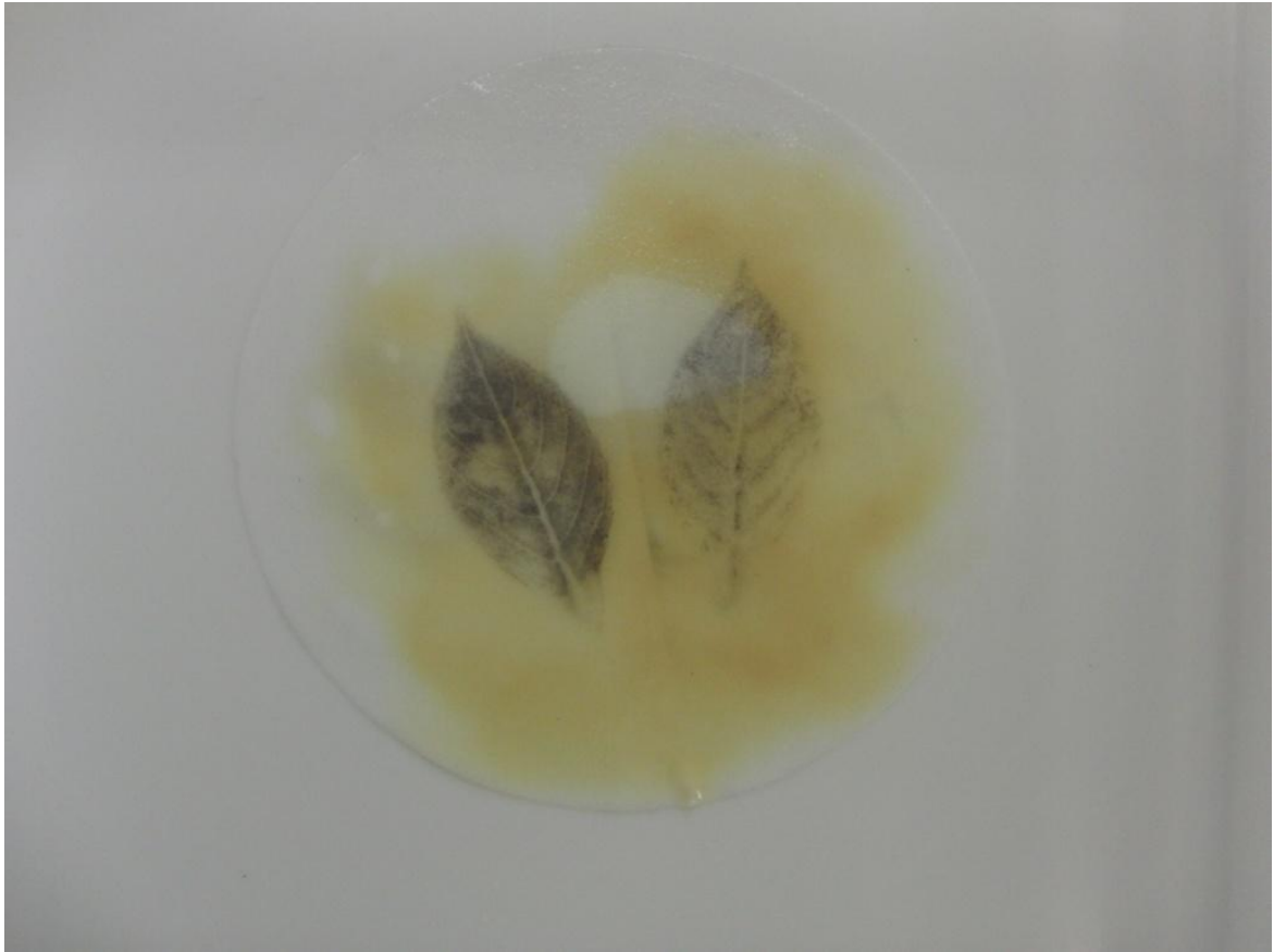
図6 まるでマジックのように、真っ白なる紙の上に現れた葉の模様 (ヨウ素でんぷん反応)

※ 真っ白なる紙から、くっきりと葉の模様が現れるようにすることが、この実験で児童・生徒を感動させるコツである。