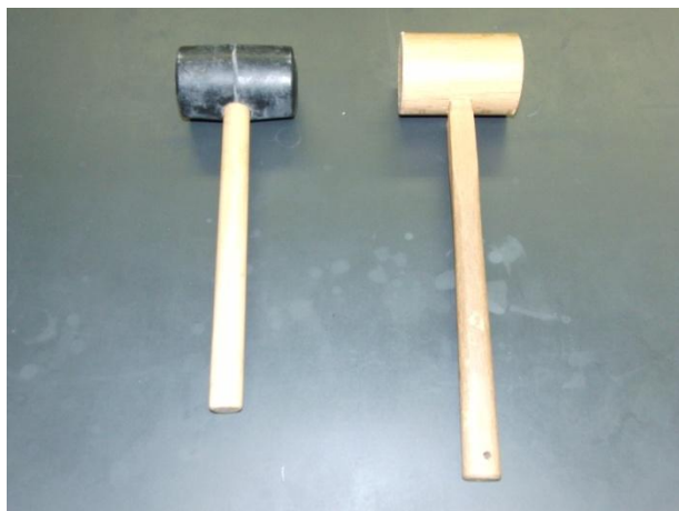
図1 100円ショップで購入したゴムハンマー(左)と木づち(右)