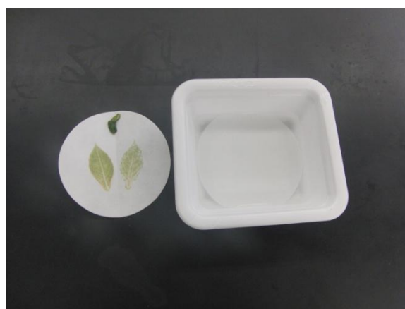
図5 完全に漂白されて真っ白になったろ紙(右側)