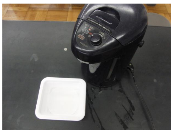
図4 熱湯はろ紙に直接かからないように縁の方にかける。

また、水で洗い流すときにも、熱湯をかけるときにも、容器の縁に水や熱湯をかけること。ろ紙に直接かけると破れてしまう。