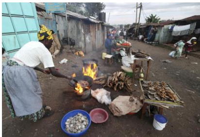
アフリカのある都市でのくらしの様子

4 アジアやアフリカの中には、経済発展から取り残されている国々もある。これらの国々と発展をとげつつあるBRICS諸国や産油国との経済格差が急速に広がっており、この問題は(⑧)と呼ばれている。