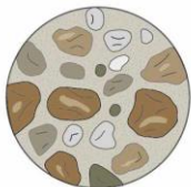
つぶの大きさ 直径2mm以上