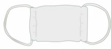
マスクのゴムひも