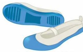
上ぐつのうらがわ